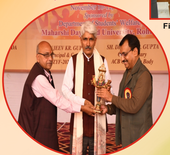
During the Zonal Youth Festival of M.D.University, Rohtak at Aggarwal College Ballabgarh