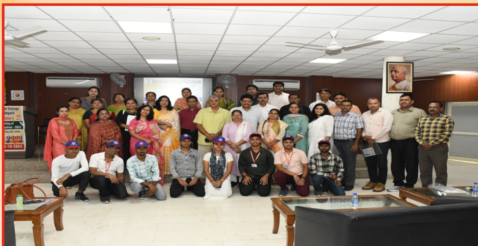
First meeting of Zonal Youth Festival at Aggarwal College Ballabgarh